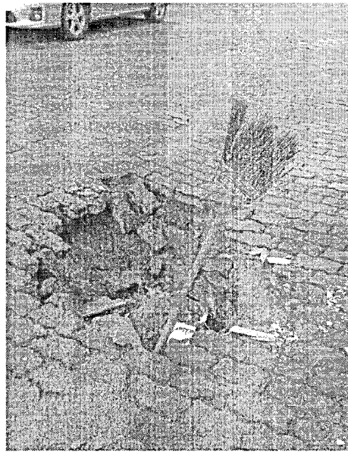
FOTO DE BURACO NA RUA COPO DE LEITE BAIRRO NOVO MÉXICO.