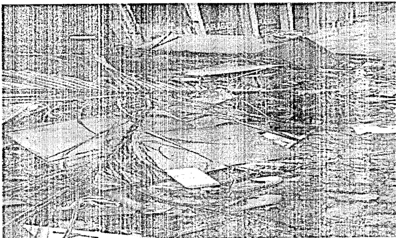
FOTO DO LIXO E ENTULHO NA RUA JOÃO DE VARGAS MARTINS NO BAIRRO ATAÍDE.